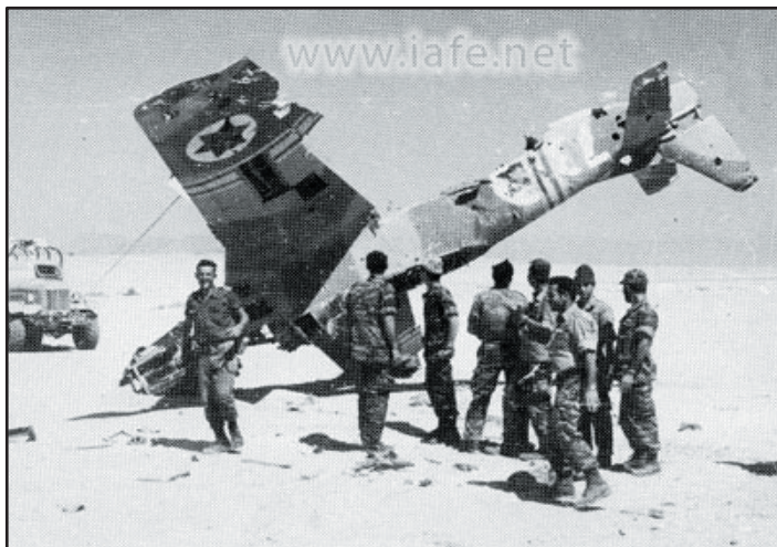
מטוסו של יונתן אטקס כפי שנמצא לאחר מלחמת ששת הימים.