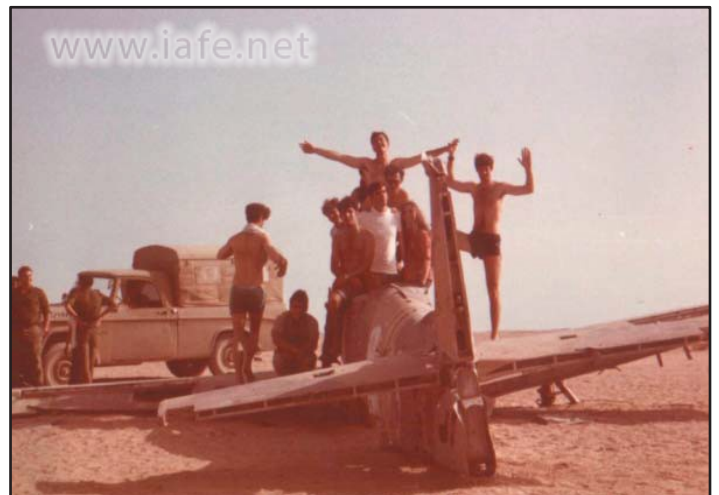
מטוסו של יונתן אטקס לאחר ש"הופל" ארצה ע"י חיילים שמצאו את המטוס לאחר מלחמת ששת הימים.