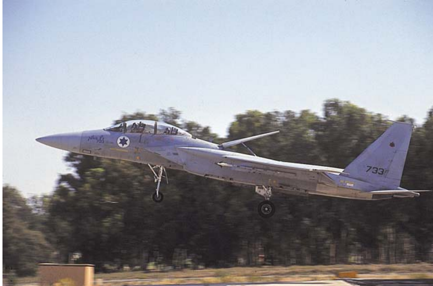
F-15D מהסוג שהתרסק בתאונה בהר עיבל