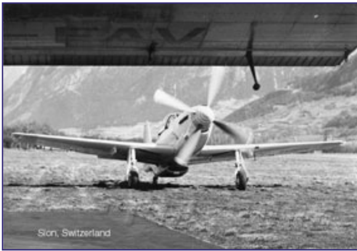
המטוס בש"ת סיון, שוויץ לפני ההסבה.