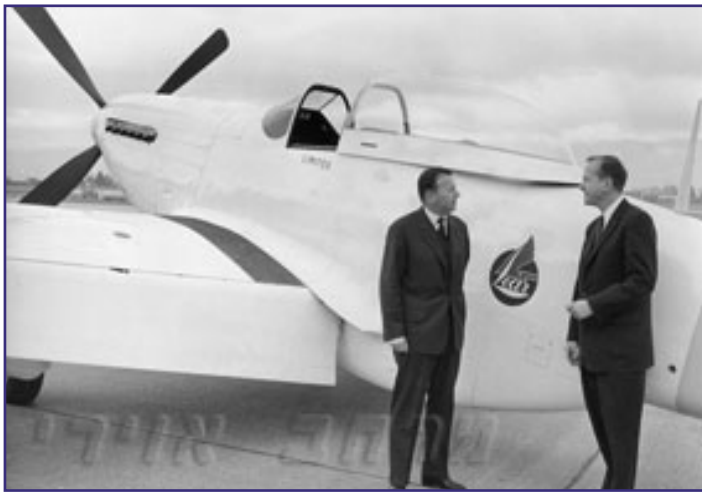
ביל ליר ואביו ליד המטוס.