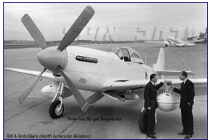
ביל ליר ואביו ליד המטוס.