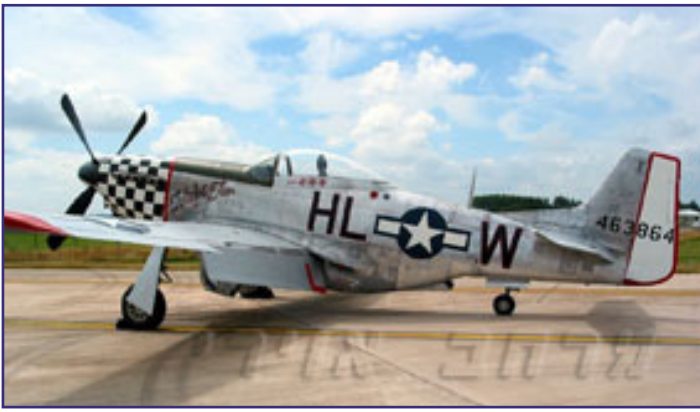
המטוס כפי שהוא נראה כיום חונה בדקספורד.