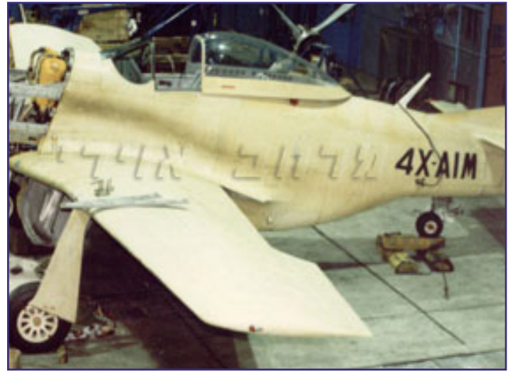
חונה במוזיאון חיל האויר.