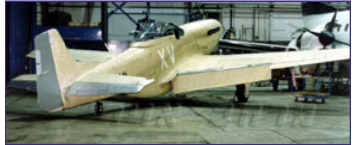
בעת השיפוץ (איי.אי.אם).