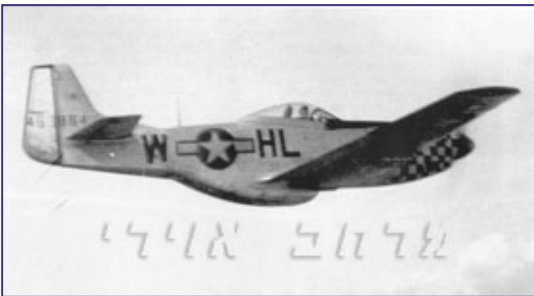
המטוס בימי מלחמת העולם ה-II.