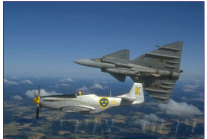
טיסת מבנה עם מטוס ויגן של כנף 16.