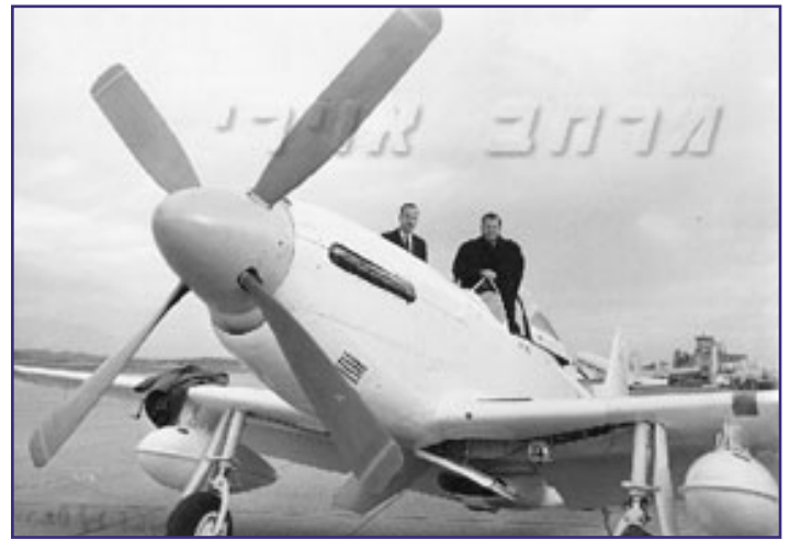
ביל ליר ואביו על המטוס.