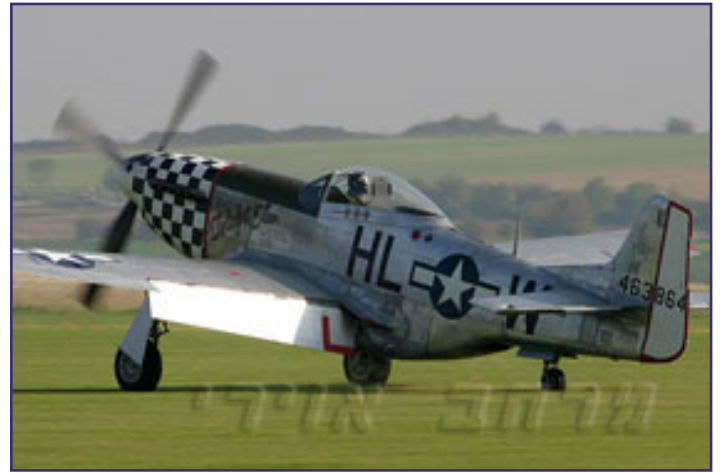
טרומ טיסה בדקספורד.