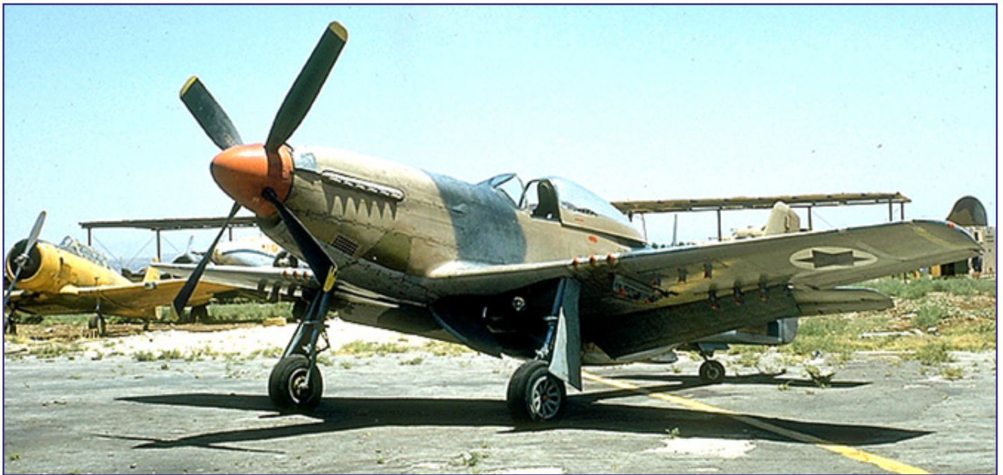
המוסטנג של ליר בתעשייה האווירית.