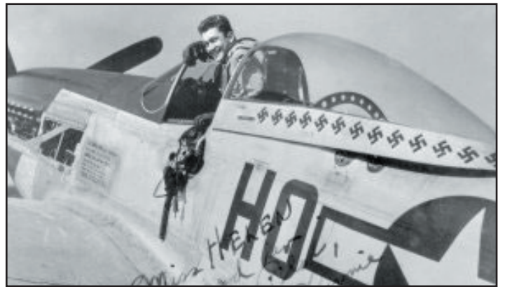
קפטין ליטג' על מטוסו - מיס הלין.