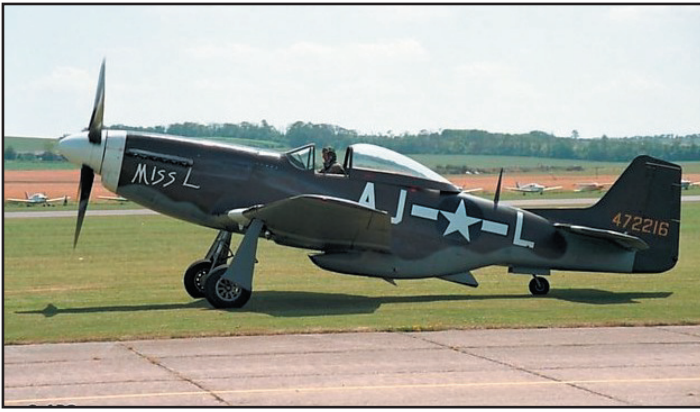
משתתף בסרט ממפיס בל.