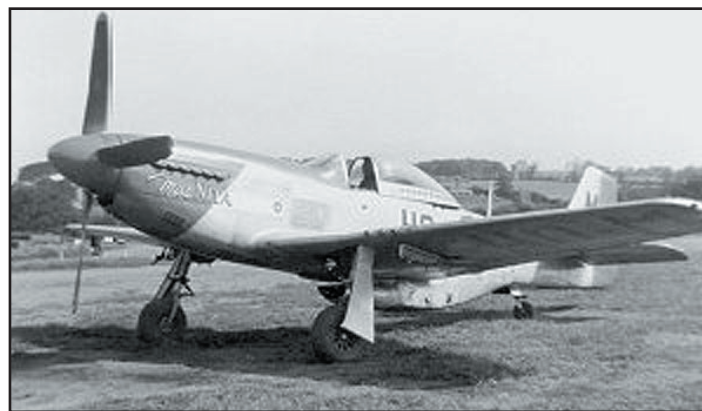
המטוס בתצלום מימי המלחמה.