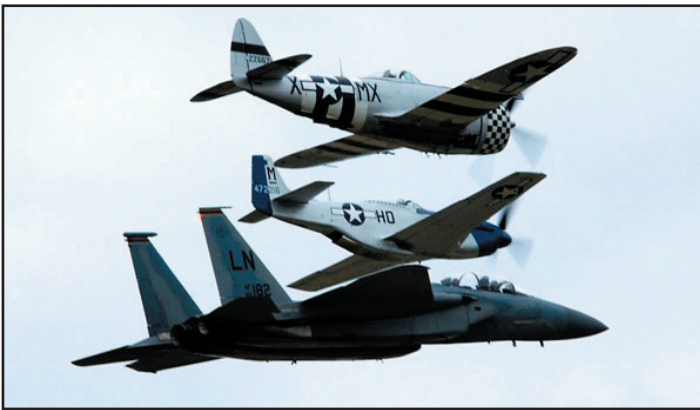
טיסת מבנה עם ות'נדרבולט F-15.