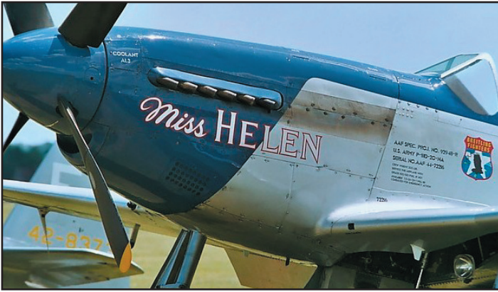
צילום תקריב של החרטום.