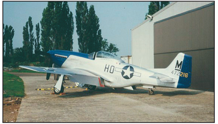
ההמטוס ליד האנגר האחסנה שלו.