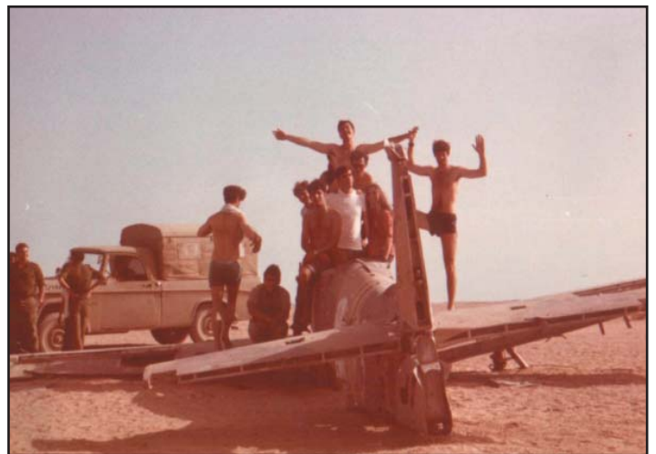
מטוסו של יונתן אטקס לאחר ש"הופל" ארצה ע"י חיילים שמצאו את המטוס לאחר מלחמת ששת הימים.