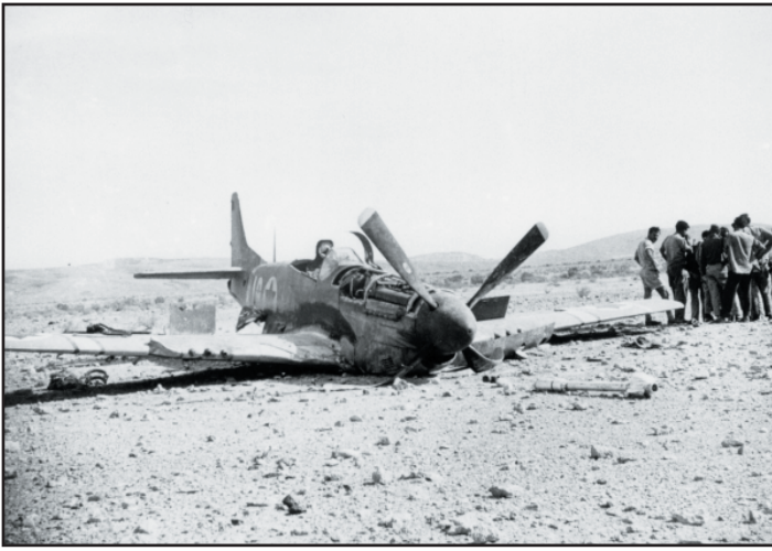
מטוס 2319 של אלדד פז.