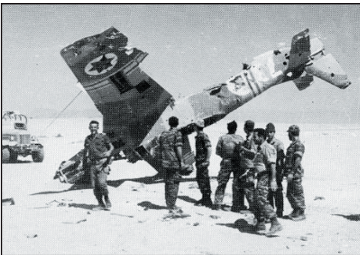
מטוסו של יונתן אטקס כפי שנמצא לאחר מלחמת ששת הימים.