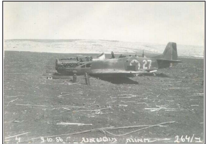
מטוס 2319 של אלדד פז - שימו לב לתאריך על התמונה