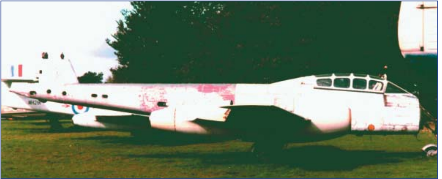
המטוס בעת הרכבתו באנגליה (מתוך חוברת המוזיאון בלאשם).