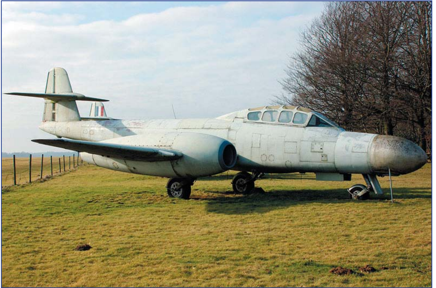
עידכון אחרון 5 בפברואר 2006 ברחבת המוזיאון.