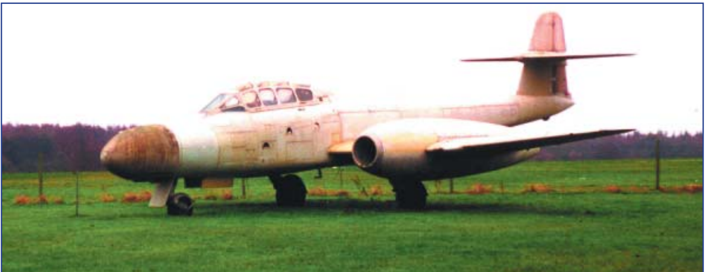
המטוס כיום ברחבת המוזיאון.