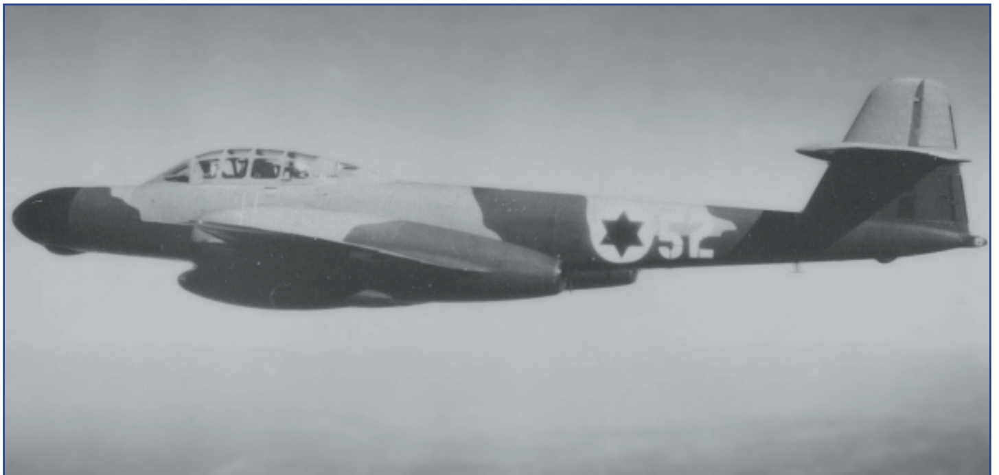
ה-52 בשירות חיל האוויר.

לפתע, דווח שיבי "נוצר מגע" כאשר גילה את המטרה כ-3 מייל מהם צפון-ית-מערבית לחופי ישראל מעל הים קרוב מאד לאי קפריסין.