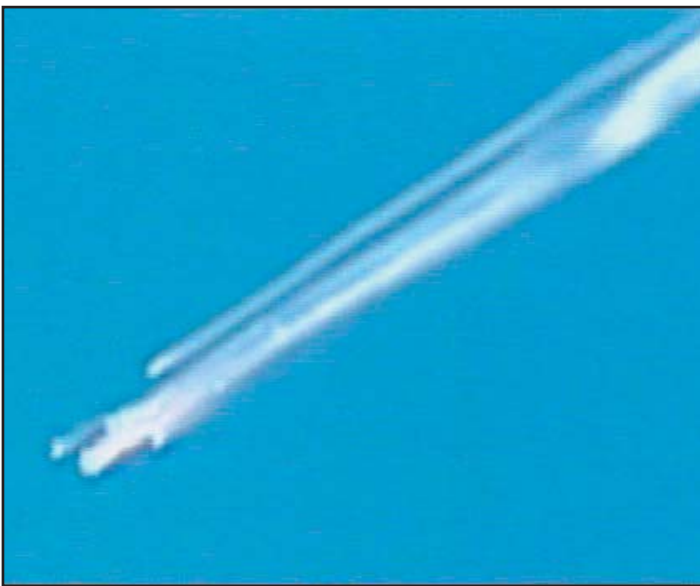
מעבורת החלל המתפרקת עם כניסתה לאטמוספירה.