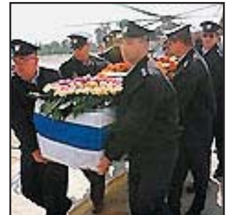
ארוןו של רמון נישא ע"י קצינים.