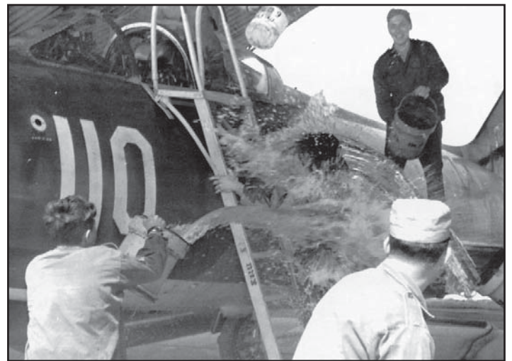
מיסטר מס' 10 נושא את סימן ההפלה. (הסיפורה הנוספת 1 הוספה בזמנו לצורך הצילום)