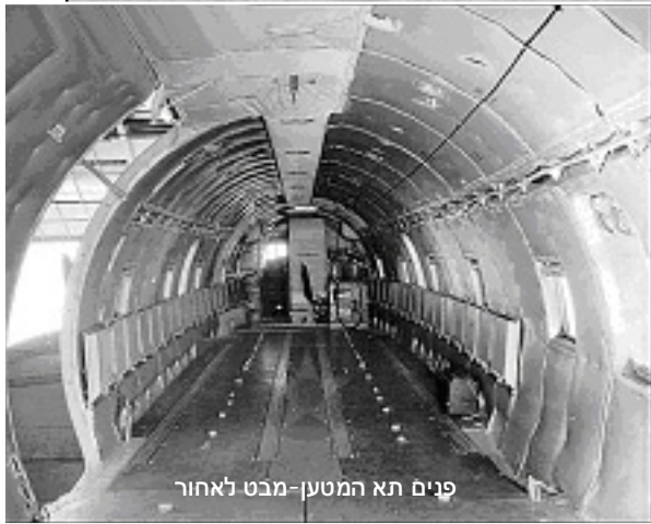
פנים תא המטען-מבט לאחור